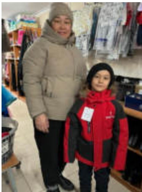
Узакбай Нуртас-8 а класс кроссовки -5000тыс.т